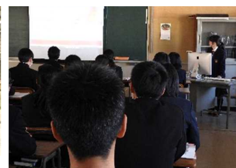
説明を聞くインテリア科1年生